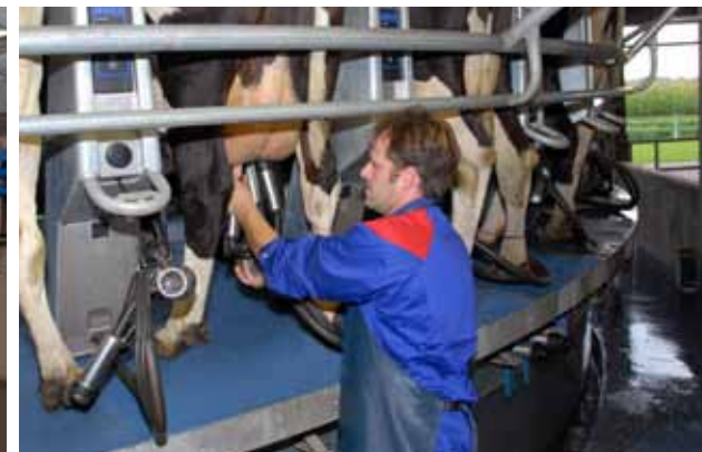
Un accès facile à la mamelle