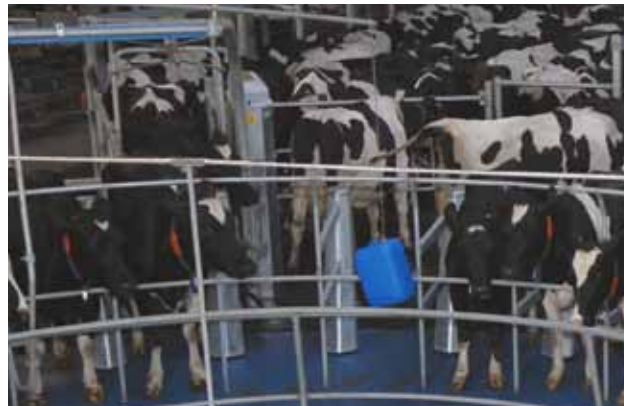
Entrée / sortie des vaches