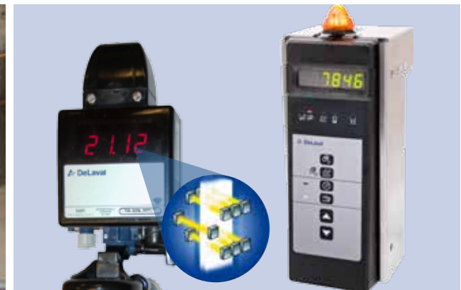
Compteur infrarouge MM27BC et MP580