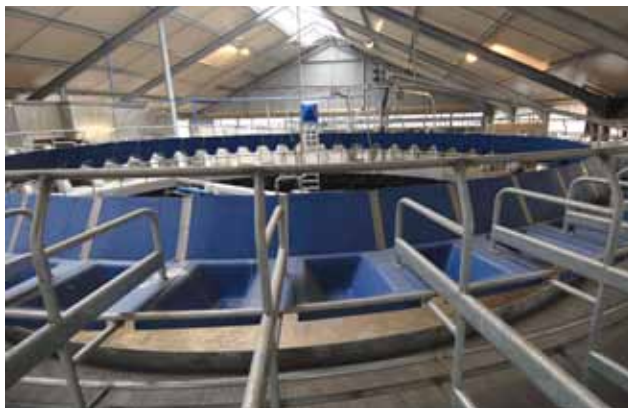
Auges avec séparations individuelles

Le plancher Comfloor réglable hydrauliquement, permet une hauteur de travail idéale, très important en cas de changement de trayeur, ce qui est souvent le cas sur ce type d'installation. Une bonne posture est essentielle pour se détendre et éviter les douleurs. Le Comfloor est un investissement très rapide à rentabiliser.