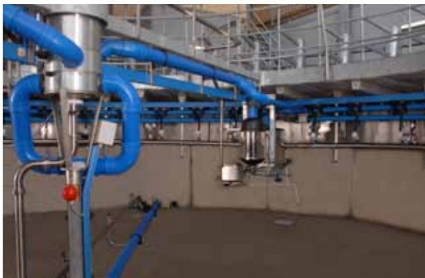
Vue de l'intérieur avec son raccord tournant