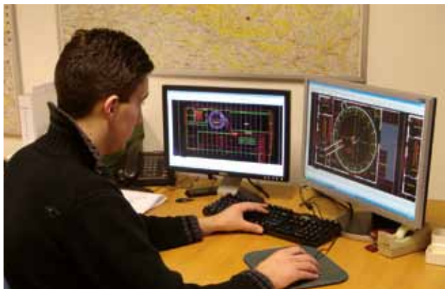
Conception professionnelle personnalisée