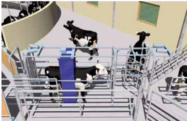
Cage de tri DSG 2 / DSG3

Une cage de tri installée dans le couloir de retour vous permettra de séparer rapidement une ou plusieurs vaches vers 2 ou 3 directions différentes. La séparation d'une vache peut être programmée directement sur la console lors de la traite ou être préalablement programmée sur l'ordinateur.