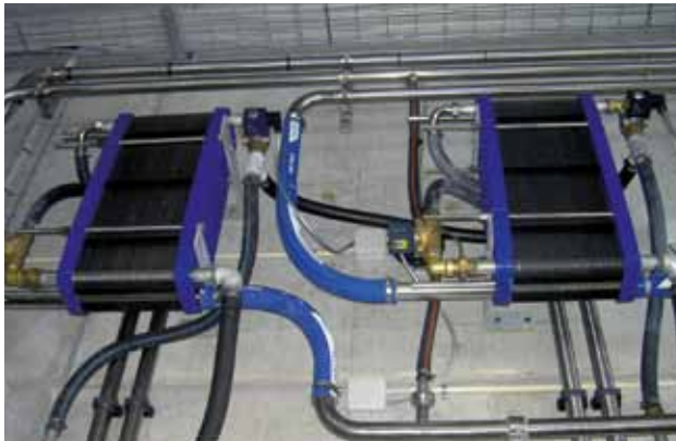
Echangeurs à plaques

En équipant votre aire d'attente d'un chien mécanique DeLaval, vous optez pour un équipement performant, fiable et sécurisé. Le chien mécanique HRS ou le chien Cow mover M, vous permet de gérer 2 lots sans arrêt de traite. L'avancement du chien est automatisé et réglé sur la fréquence d'entrée des vaches sur la plate-forme. Un chien a tout spécialement été étudié pour les cas où les vaches sont regroupées dans un couloir : le chien Cow mover C.