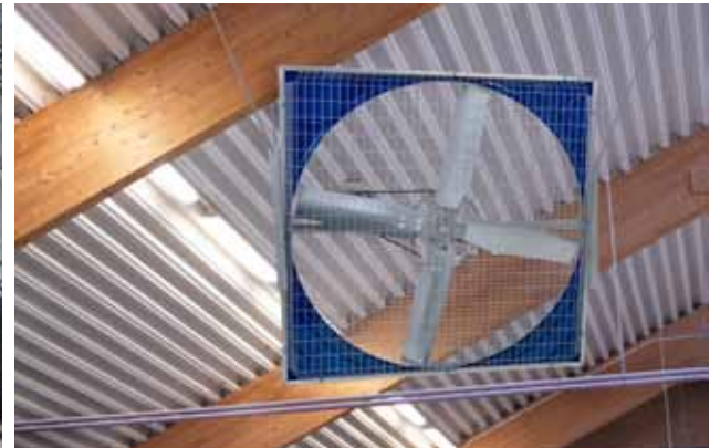
Ventilateur DF1270 DeLaval

Pour optimiser la routine, les vaches pénétrant sur la plate-forme doivent être les plus propres possibles. En nettoyant régulièrement les aires d'exercices, vous simplifiez votre routine de traite. DeLaval possède une large gamme de racleurs adaptés aux différents bâtiments et types de lisiers.