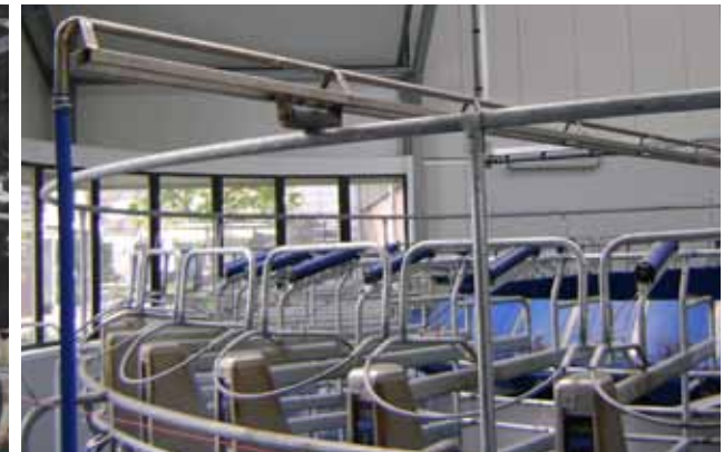
Plate-forme avec barre de retenue (second tour)