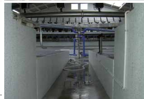
Vues de droite : En haut - Eclairage parfait / Au centre - Poste de travail confortable / En bas - Passage souterrain