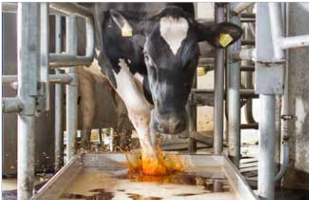
Bac pédiluve automatique AFB 1000