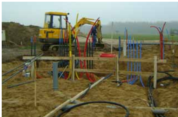
Suivi des différentes étapes d'un chantier