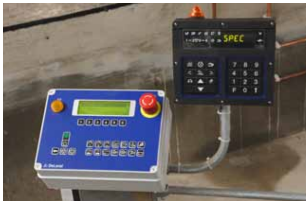
Pupitre RC 70 associé au MP 680