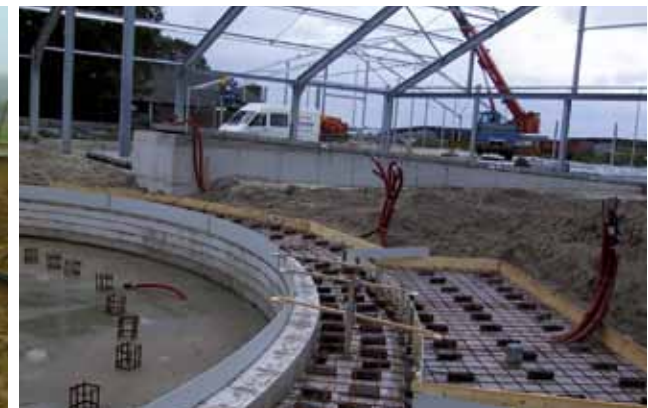
Fondations et préparation maçonnerie