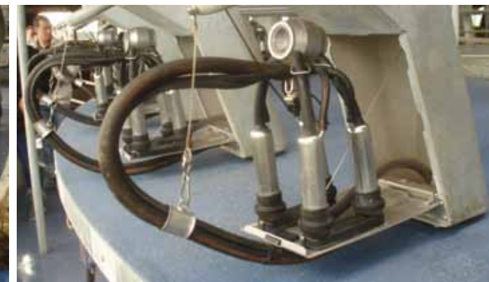
Accessibilité exceptionnelle de la mamelle